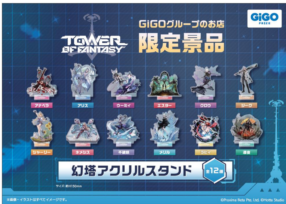
▲幻塔 アクリルスタンド（全12種）