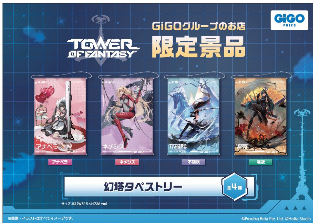
▲幻塔 タペストリー（全4種）